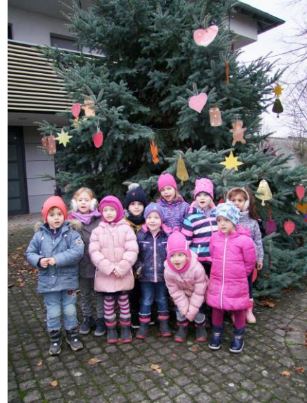
Happerschoß, im Dezember 2019